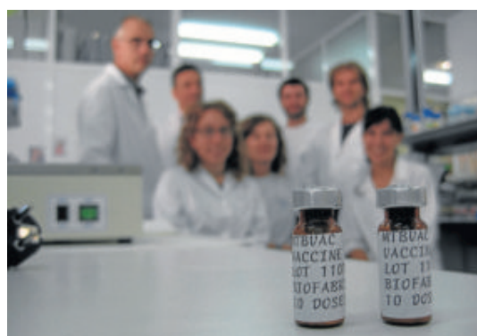
La nueva vacuna de la UZ contra la tuberculosis ya se ensaya en humanos.