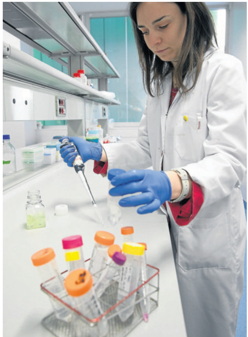
En el CIBA se alimentan células asesinas para, si prospera la técnica, ser inyectadas en los pacientes. COMUNICACIONES MIL

La investigación básica muestra aquí todo su valor; es la que revela los mecanismos de funcionamiento del organismo. «Es absolutamente necesaria para buscar nuevas dianas moleculares, más espe-